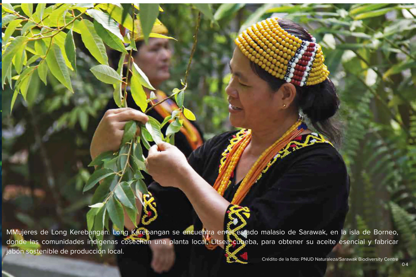
MMujeres de Long Kerebangan. Long Kerebangan se encuentra en el estado malasio de Sarawak, en la isla de Borneo, donde las comunidades indígenas cosechan una planta local, Litsea cubeba, para obtener su aceite esencial y fabricar jabón sostenible de producción local.

Si está interesado en contribuir a través de su Gobierno, pero no está seguro de si se ha establecido o se establecerá un sistema de este tipo, puede ponerse en contacto con el punto focal nacional de su Gobierno: www.cbd.int/information/nfp.shtml